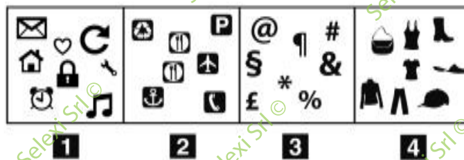
FIGURA UZ 26

39 Rispondere al seguente quesito facendo riferimento alla FIGURA UZ 26